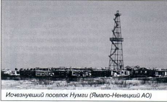
Исчезнувший поселок Нумги (Ямало-Ненецкий АО)

производства бетона. Но ведь песок и у нас есть, скажет уважаемый читатель. Да, песок есть, а железной дороги, в отличие от Ульт-Ягуна нет. Мы, кроме автомобильной трассы (и увы, не федерального значения) ничего не имеем. Вертодром не в счет – он только для нужд нефтяников. Вот и получается, что небольшое поселение Ульт – Ягун для инвесторов привлекательнее Лянтора, с его 40 тысяча-