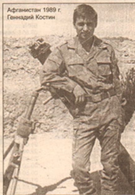
Афганистан 1989 г. Геннадий Костин

неоднократно нарушалось. Вообще, здесь многое было делать нельзя советским солдатам (кстати, по воспоминаниям бывшего воина-интернационалиста, при переходе через границу одели всех в одинаковую форму-«варшавку». Поэтому, понять к какому роду войск ты относишься, было