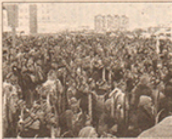
Около 8000 человек стали участниками забега в г. Сургуте

10 февраля в Сургуте на реке Сайма прошло одно из самых массовых спортивных мероприятий страны. Впервые город Сургут вошел в число 152 городов России, где уже более двадцати лет проводят «Лыжню России»