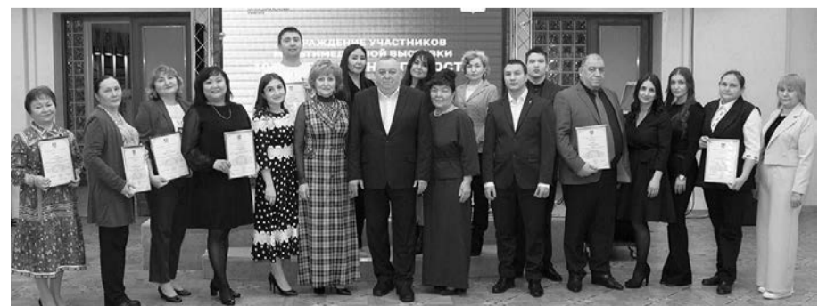
Материалы полосы подготовили Оксана Львова, Артур Абдурагимов

Напомним, в вековой юбилей Сургутский район открыл уникальную выставку. Ее разместили в мультимедийном историческом парке «Россия – Моя история. Югра», где 10 февраля состоялся День Лянтора. В пространстве выставки проходили различные мастер-классы, выступали творческие коллективы города, а также выставка-ярмарка ремесел местных мастеров.