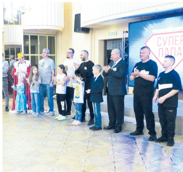
Автор: Николай Сапожников Фото из открытых источников

Первое празднование Дня отца в России состоялось в 2014 году в Москве. С этого времени он проходит ежегодно не только в столице, но и в других городах. В этом году и Лянтор присоединился к этому списку.