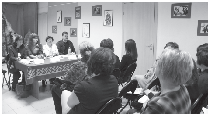
Участники районного семинара "Лаборатория музееведения"

Кроме представления своих докладов, у участников была возможность и практиковаться. На мастер - классах от представителей музеев района они изучали особенности традиционного хантского костюма, украшений, орудий труда, предметов обихода, утвари и игрушек.