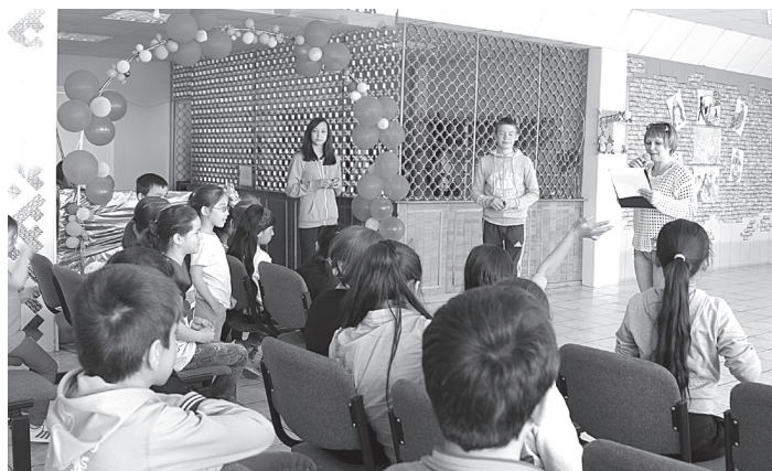
Лянторские ребята отгадывают загадки

На протяжении первой смены на летней площадке будут проходить виртуальные экскурсии по значимым местам, памятникам, событиям нашей страны. По словам организаторов, все мероприятия подобраны и продуманы так, чтобы отдых был разнообразен и интересен каждому ребёнку, ведь возраст их колеблется от 6 до 16 лет. Несмотря на то что возрастной разрыв велик, все ребята учатся общаться между собой, всегда стараются помочь самым маленьким. Здесь каждый день неповторим и своеобразен по - своему, а каждый последующий день наполнен новыми мероприятиями, новыми эмоциями и впечатлениями.