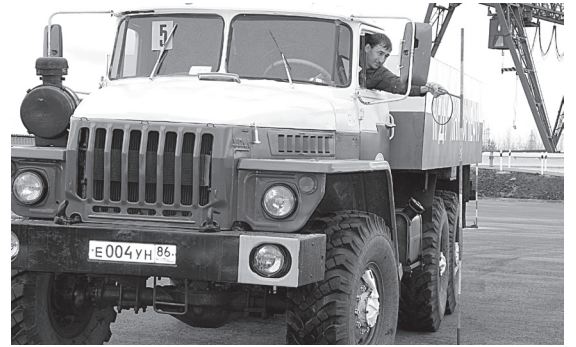
Выполнение одного из заданий смотра - конкурса "Лучший по профессии"

В результате упорной борьбы спортивный азарт всё же взял своё.