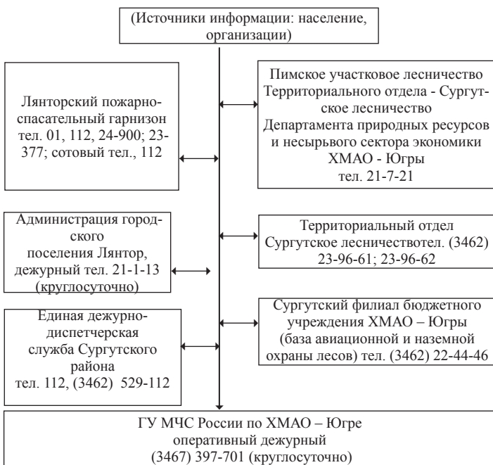
Схема связи и оповещения при возникновении лесных пожаров

Приложение 6 к постановлению Администрации городского поселения Лянтор от «28» апреля 2017 года № 502