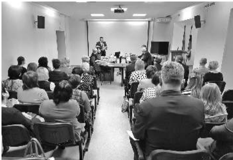
Аппаратное совещание

ПЯТОГО АПРЕЛЯ СОСТОЯЛОСЬ ПЛАНОВОЕ СОВЕЩАНИЕ РУКОВОДИТЕЛЕЙ УЧРЕЖДЕНИЙ ПРИ ГЛАВЕ ГОРОДА