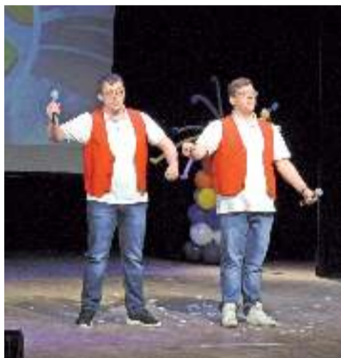
Близнецы из "Рядом стоящих"