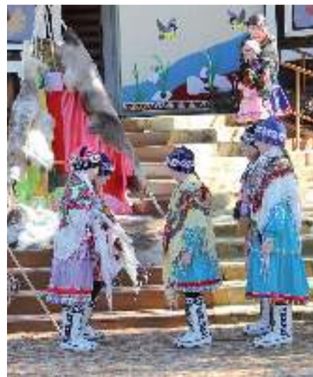
Выступление ансамбля "Пимочка"

люльки младенцев, все мамочки выкидывали в одно место на окраине деревни. Воронам весной нравилось сидеть на образовавшейся за зиму преющей горе стружек: она теплее, чем рыхлые сугробы вокруг. Сельчане же, заметив первых ворон, радовались: вороны прилетели, значит и весна скоро. Чем не повод для праздника?! Воронья любовь к человеческим младенцам, думается нам сильно преувеличена, но в фольклоре манси есть песня, где именно ворона желает женщинам родить побольше «долгоживущих» мальчиков и девочек, чтобы и на следующий год она смогла отогреть свои лапки на кучках березовой трухи.