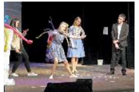
Команда "Лосьон для души"