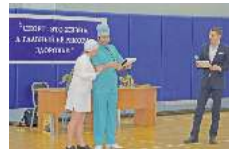
Вместе с ведущими в празднике участвовал... медперсонал

В спортивном зале культурно-спортивного комплекса «Юбилейный» 8 апреля состоялся городской спортивный праздник, посвящённый Всемирному дню здоровья. Мировая общественность отмечает его ежегодно, 7 апреля, в день создания Всемирной Организации Здравоохра-