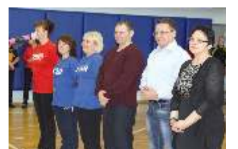
Участников поприветствовали представители администрации

учреждений «Дошколята», «Здравейеры» детского сада «Журавушка» и «Дружба» Лянторской средней школы № 5. Программа праздника включала в себя шесть различных творческих и спортивных конкурсов и эстафет. Команды-победители определялись по наименьшей сумме мест, занятых во всех конкурсах. По итогам состязаний, набрав 9 баллов, победу одержали «Дошколята». Второе место завоевала весёлая