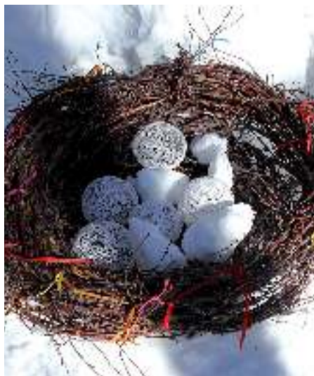
Атрибут праздника - "Воронье гнездо"

Впрочем, однозначно утверждать, будто не было никогда такого праздника – нельзя. Обычай коренных малочисленных народов Севера восходит наблюдениям за природой, птицами и животными. Племена, проживающие на Казыме, селились более крупными поселениями, чем пимские ханты. Использованную древесную стружку и мягкие опилки, которыми выстилали