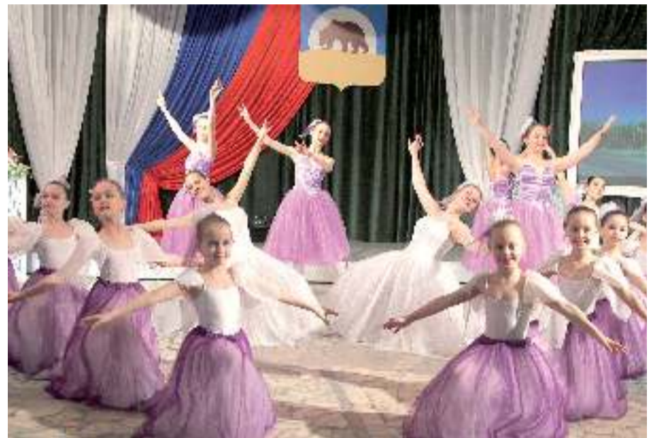
Танцевальный номер для муниципальных служащих