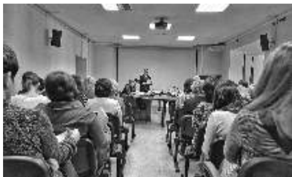
В зале совещаний Администрации города

С 1 марта 2015 года вступил в силу Федеральный закон № 171-ФЗ «О внесении изменений в Земельный кодекс Российской Федерации и отдельные законодательные акты Российской Федерации». С указанной даты управление и распоряжение земельными участками, государственная собственность на которые не разграничена, осуществляет Администрация города Лянтор. Общая площадь