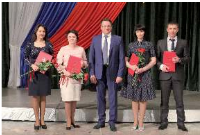
Работники Администрации, награждённые Благодарственными письмами Главы города

стола, занималась постановкой на учёт военнотрудовых. Сейчас на пенсии.