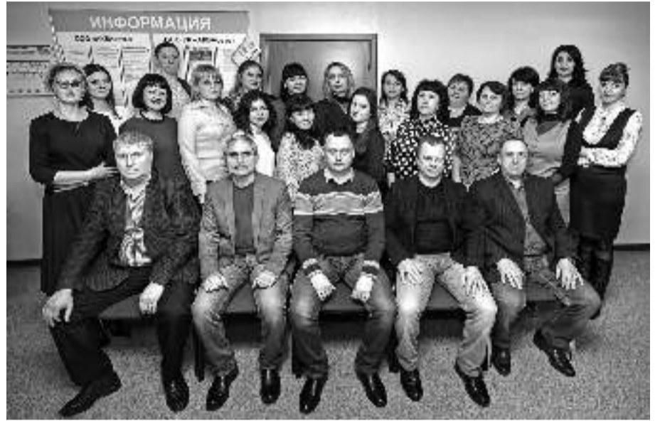
Коллектив ООО «АКВАСеть»