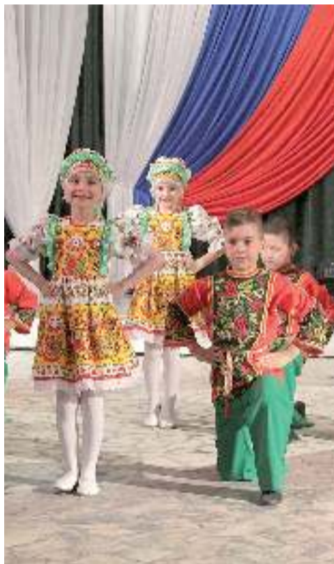
Народные мотивы в выступлении юных артистов

ку богатейшему нефтяному месторождению, сколько настойчивости жителей, стремящихся обустроить среди здешних болот – собственный «город-сад», где было бы приятно жить и думать о дальнейших перспективах развития. Несмотря на суровый климат и экономические сложности, путь Лянтора к благоустройству и комфортному будущему не прекращается и сегодня. А нам, живущим здесь и сейчас, выпала счастливая возможность не только быть тому свидетелями, но и участвовать в изменениях к лучшему.